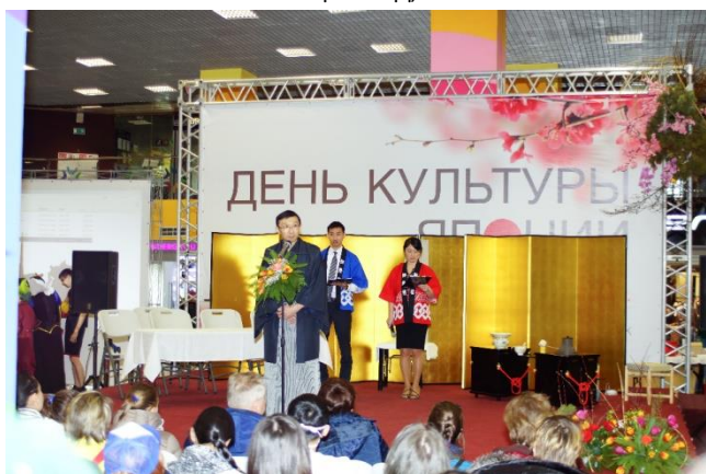
Приветственное слово генерального консула Акира Имамура