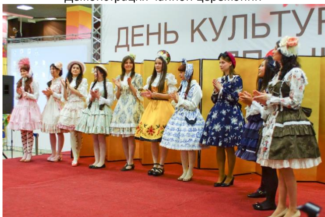
Демонстрации моды «лолита»