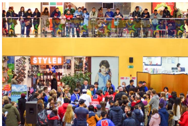
Общий вид, 2