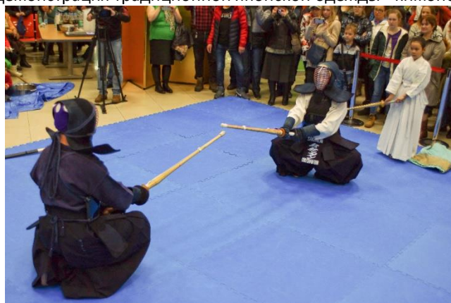
Демонстрация боевых искусств: кэндо