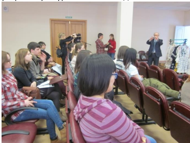
Перед началом мероприятия

Генеральное консульство Японии 14 марта организовало знакомство студентов СахГУ ИВСиТ с аспектом популярной культуры Японии – модой «лолита».