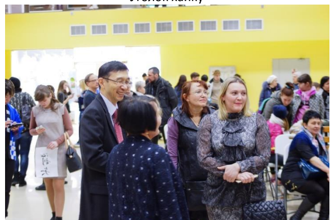
Участники мероприятия и генеральный консул Акира Имамура