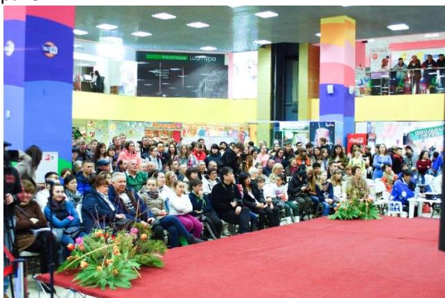
Общий вид, 1

Генеральное консульство Японии 13 марта при поддержке ТРК «Сити-Молл» в третий раз провело День культуры Японии, на котором сахалинцы смогли познакомиться с традиционной и популярной культурой страны.