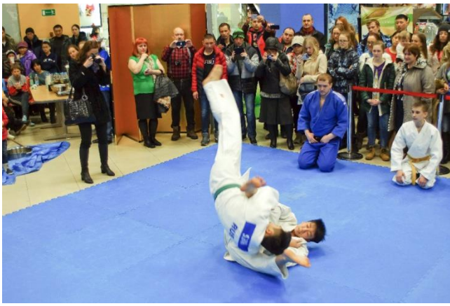
Демонстрация боевых искусств: дзюдо