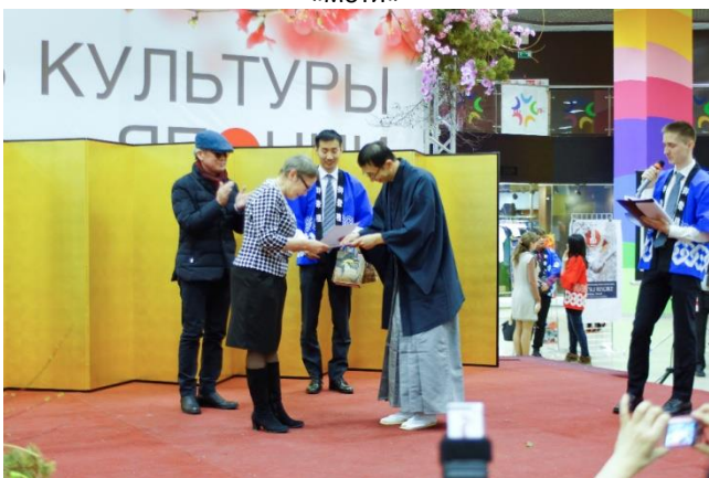
Награждение победителей конкурса японской поэзии хайку на Сахалине