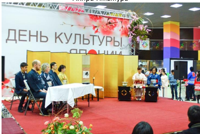
Демонстрация чайной церемонии