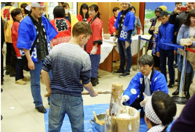
Сахалинцы пробуют приготовление японских лепешек «моти»