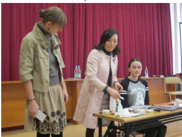
Представитель «Кита-лоли» наносит макияж студентке