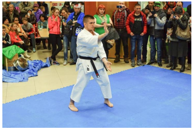
Демонстрация боевых искусств: каратэ