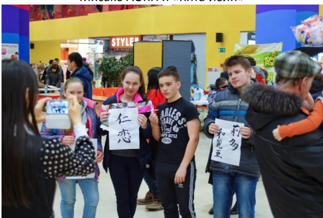
Юные посетителя Дня культуры Японии на Сахалине