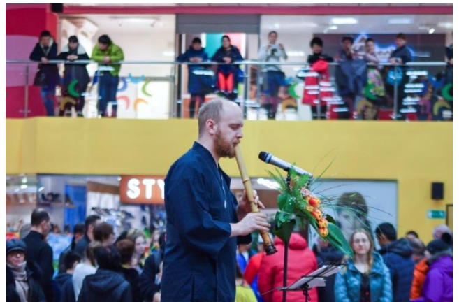
Игра на японском музыкальном инструменте «сякухати»