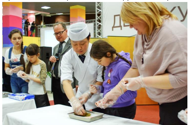
Мастер-класс по изготовлению «сакурамоти»