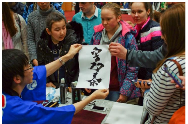
Сахалинцы знакомятся с каллиграфией