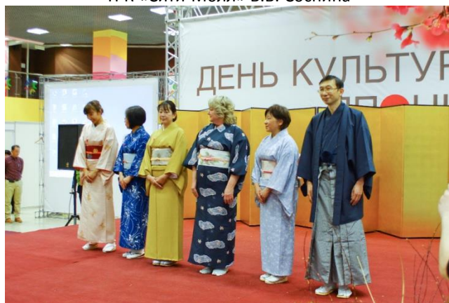
Демонстрация традиционной японской одежды «кимоно»