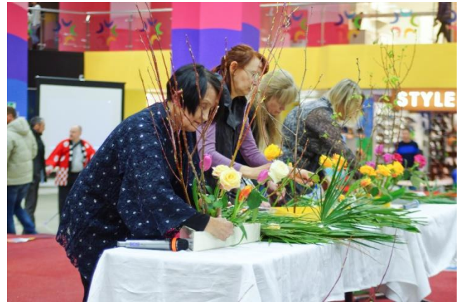
Демонстрация искусства аранжировки цветов «икебаны»