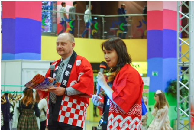
Презентация туризма острова Хоккайдо