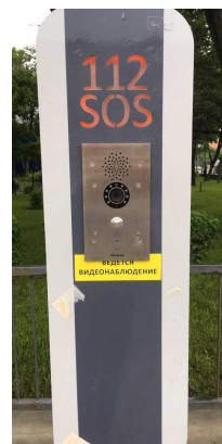
街角の所々に押しボタン式の緊急通報装置が設置されています。